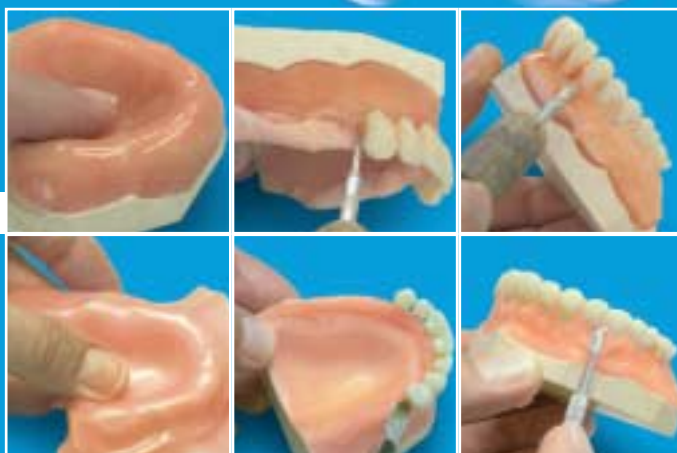
Protesi totale convenzionale